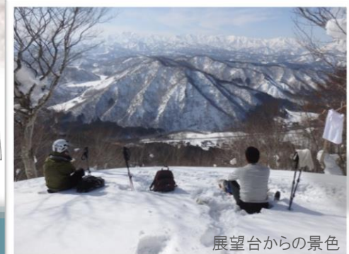
展望台からの景色