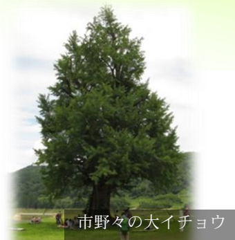
市野々の大イチョウ