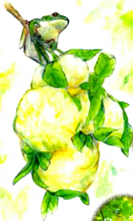
モリアオガエルのたまご